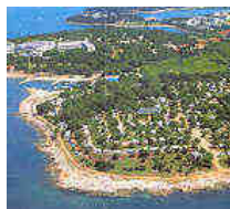
il campeggio di Zelena Laguna

Ricordiamoci che siamo tutti in gita (compresi gli organizzatori)