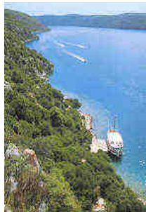
Il canale (fiorde) di Lem