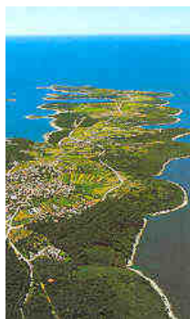
La penisola di Premantura