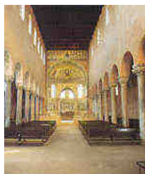
La basilica Eufrasiana di Parenzo