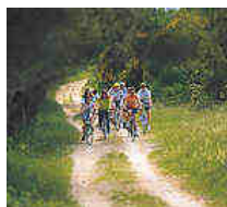
speriamo di trovare spazio per una sgranchita in bicicletta