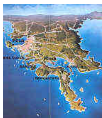
Mappa di Pola con le penisole di Medulin e Premantura