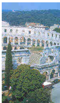
l'arena di Pola