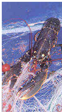
per chi non va in bicicletta, c'è sempre la pesca...