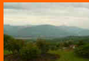
panorama dai sentieri di Roncoi