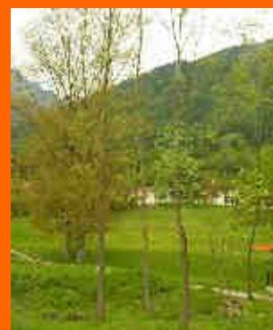
dall'area di sosta di Roncoi

collegarsi poi alle pagine San Gregorio e dintorni con interessanti proposte di percorsi e sentieri ai margini del Parco delle