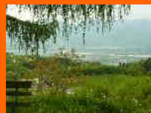
vista dai sentieri di Roncoi