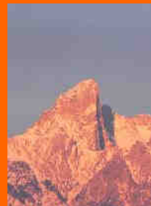
tramonto sul Pizzocco