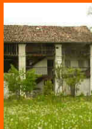
casa tradizionale nel centro di S. Gregorio