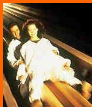
le miniere di sale di Hallein

La sosta ad Hallein, dove dovremmo giungere per le 15.30 circa, è programmata per la visita alle celebri miniere di sale ora dismesse (salvo variazioni il biglietto d'ingresso dovrebbe avere un costo di € 15.50 per adulti, € 9.30 per i ragazzi tra 7 - 15 anni ed € 7.75 per bambini tra 4 - 6 anni); trattandosi di miniere di sale il prezzo del biglietto è ovviamente piuttosto "salato", ma si dice che la visita sia