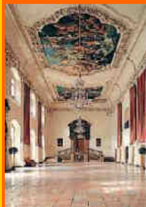
e i lussuosi interni