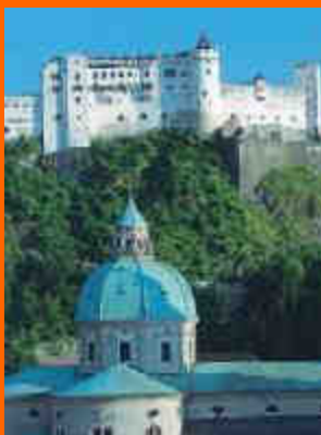
la fortezza di Salisburgo