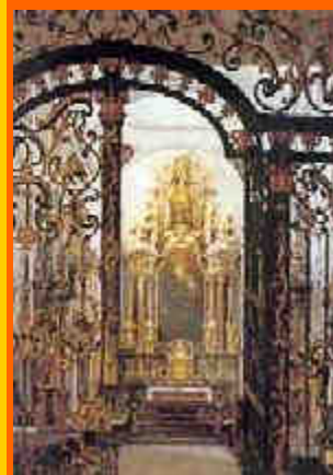
l'abbazia di St. Peter