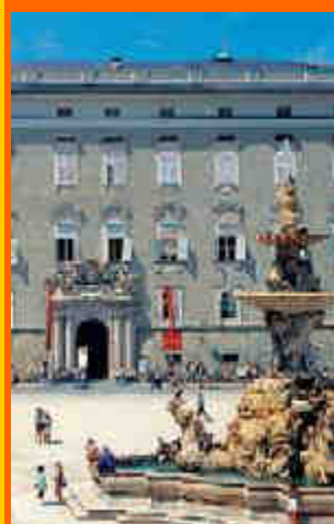
Residenz con la sua famosa facciata