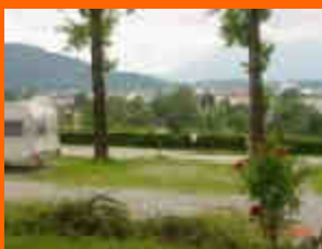
il campeggio di Salisburgo