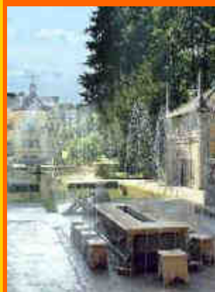
i giochi d'acqua e il teatrino idraulico a Hellbrunn