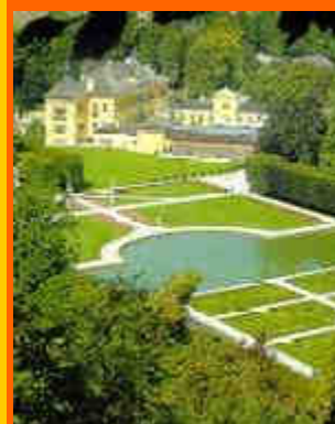
Il celebre parco del castello di Hellbrunn