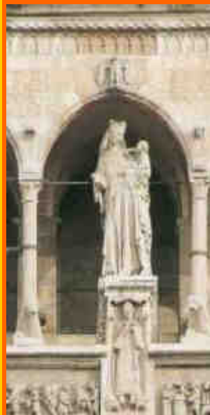
Madonna con Bambino