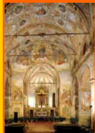
S. Maria delle grazie a Soncino