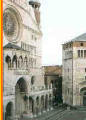
Il celebre Duomo di Cremona con a fianco il Battistero

Nonostante chi organizza metta tutto il suo impegno perché le cose vadano al meglio, gli organizzatori non si ritengono responsabili per disguidi e/o ritardi ed altri accadimenti che potesse avvenire ed i partecipanti sono calorosamente invitati a farsi parte attiva, sia informandosi dello svilupparsi del programma, sia collaborando alla sua riuscita, sia soprattutto pazientando per gli inevitabili contrattempi. Ricordiamoci che siamo tutti in vacanza (anche chi organizza).