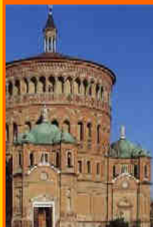
veduta di S.Maria della Croce a Crema