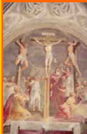
Crocifissione di B.Campi a S.Bassiano di Pizzighettone