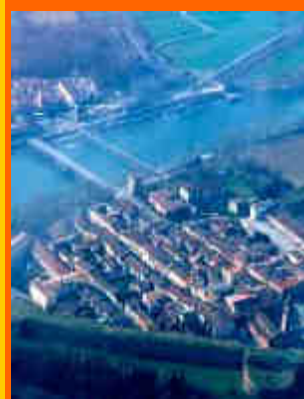
veduta aerea di Pizzighettone